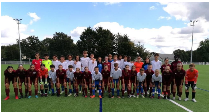
Match contre SSSR féminine, pensionnaire également du collège Saint-Exupéry.